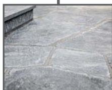
Kunst- / Natursteinböden