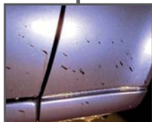
Teer & Wachs