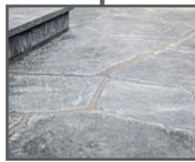
Kunst- / Natursteinböden