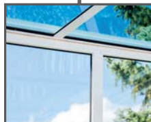
Kunststoffe (z.B. Fenster)