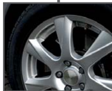
Aluminiumfelgen (stark verschmutzt)