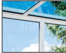
Kunststoffe (z.B. Fenster)